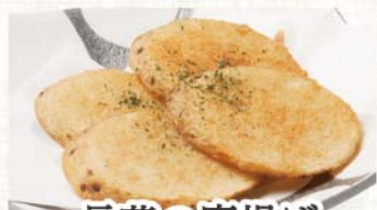
長芋の唐揚げ 364円(税込400円)