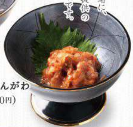
黄金カレーのえんがわ 437円(480円)