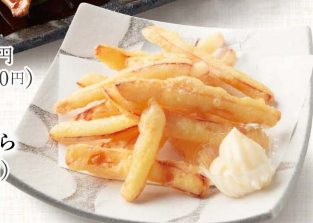
さきいかの天ぷら 619円(税込680円)