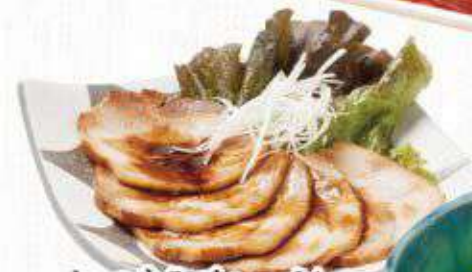
おつまみチャーシュー 437円(480円)