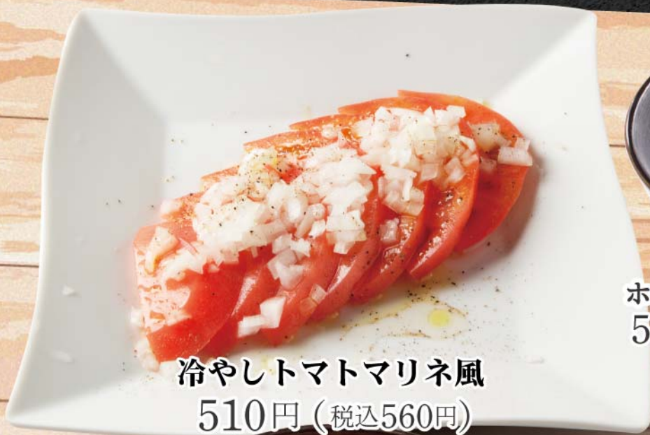
冷やしトマトマリネ風 510円 (税込560円)