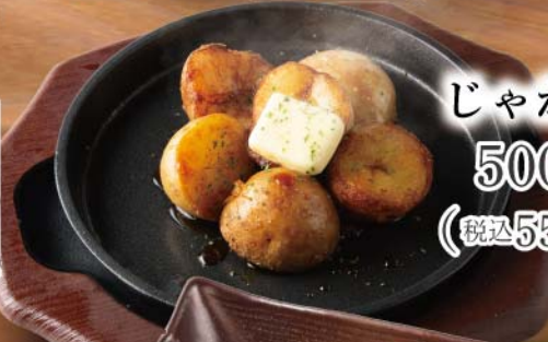
じゃがバター 500円 (税込550円)