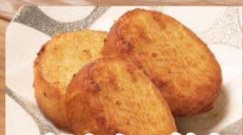
ポテトチーズもち 528円(税込580円)