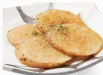
長芋の唐揚げ 300円(330円)