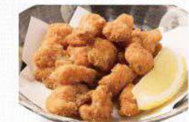
なんこつ唐揚げ 382円(420円)