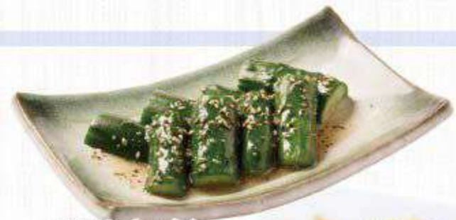
塩だれきゅうり 291円(320円)