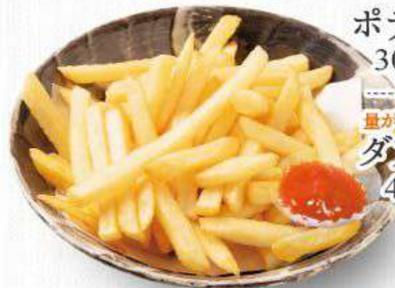
量が2倍の! ダブルポテト 446円(490円)