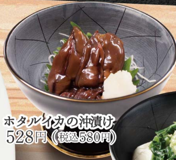
ホタルイカの沖漬け 528円 (税込580円)