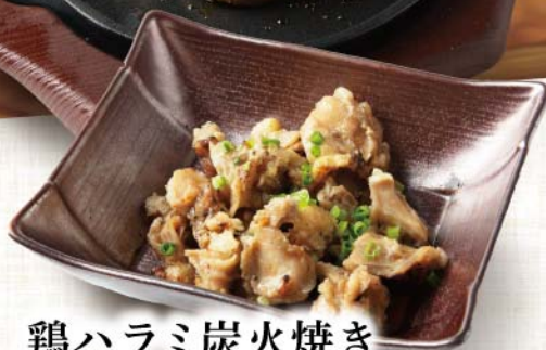
鶏ハラミ炭火焼き 591円(税込650円)