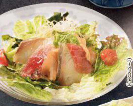
海鮮和風サラダ 673円(740円)