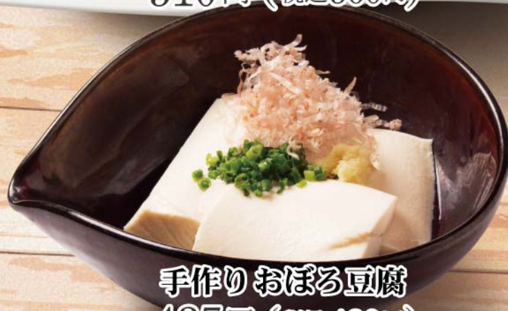
手作りおぼろ豆腐 437円 (税込480円)