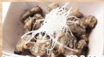
無限なんこつ炭火焼き 673円(税込740円)