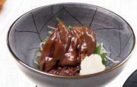
ホタルイカの沖漬け 391円(430円)