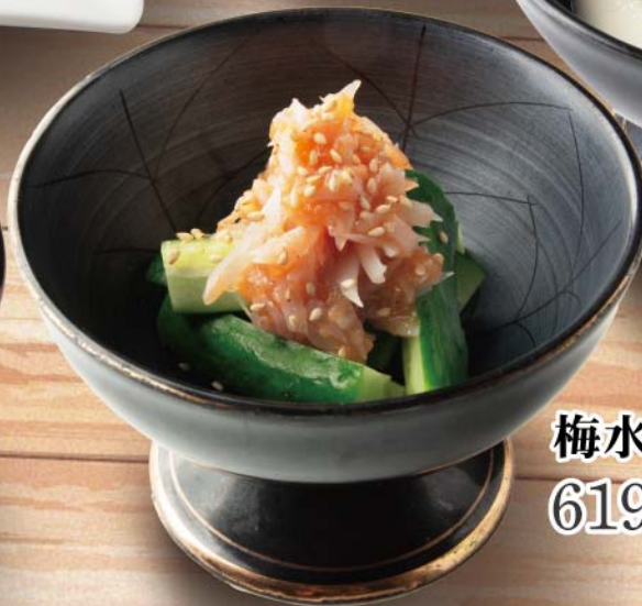
梅水晶ときゅうり 619円 (税込680円)