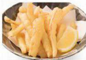
さきいか天ぷら 446円(490円)