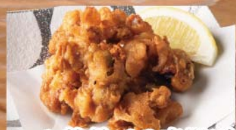
いか軟骨ピリ辛揚げ 591円(税込650円)