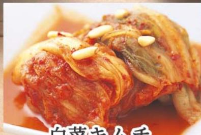
白菜キムチ 346円 (税込380円)