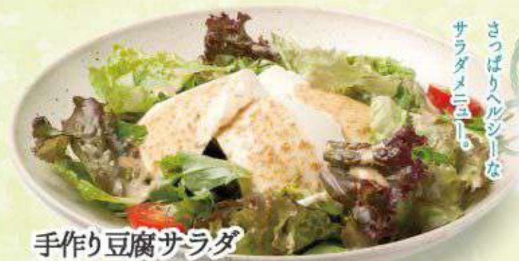
手作り豆腐サラダ 491円(540円)