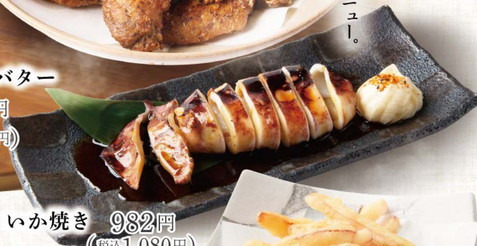
いか焼き 982円 (税込1,080円)