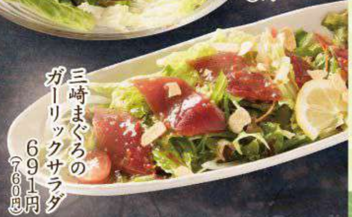
三崎まぐろの ガーリックサラダ 691円(760円)