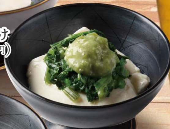
わさび豆腐 410円 (税込450円)