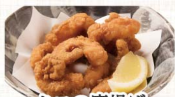
タコの唐揚げ 619円(税込680円)