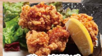
鶏の唐揚げ 491円(税込540円)