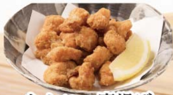
なんこつ唐揚げ 510円(税込560円)