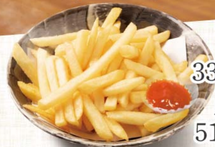
ポテトフライ 337円(税込370円)