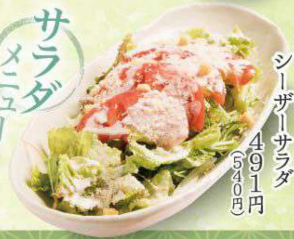
とまと シーザーサラダ 491円(540円)