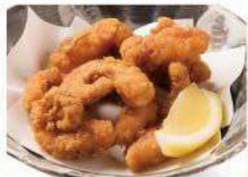
タコの唐揚げ 437円(480円)