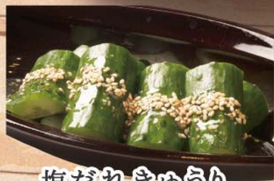
塩だれきゅうり 346円 (税込380円)