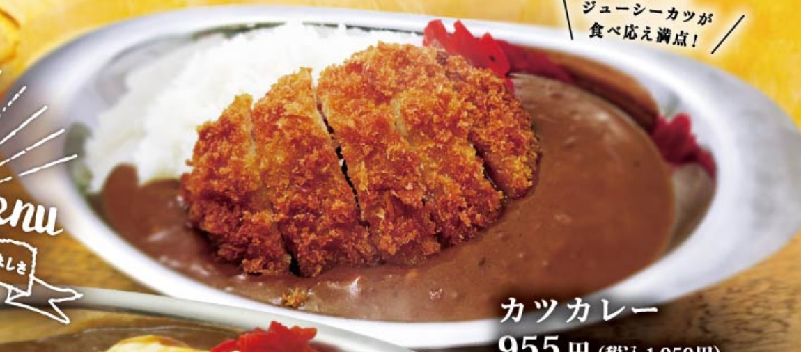
カツカレー 955円(税込1,050円)