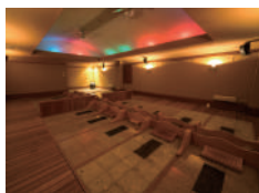
岩盤浴 (フリータイム制)