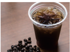
ドリンクコーナー (今だけ無料)