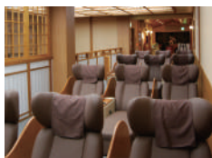
リクライニング チェア