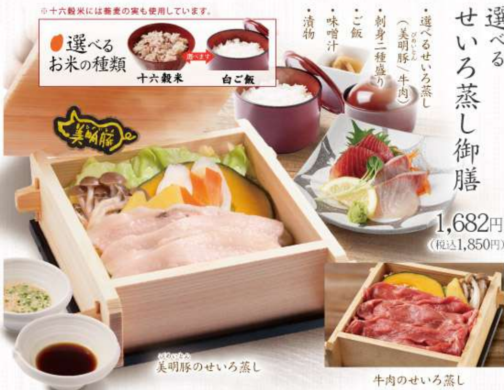
美明豚のせいろ蒸し