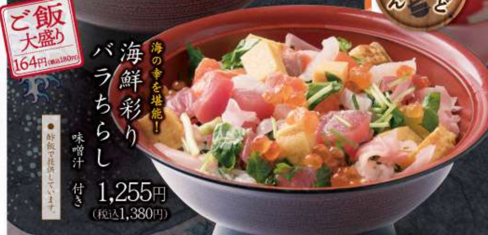
海鮮彩り バラちらし 海の幸を堪能! 味噌汁 付き 1,255円 (税込1,380円)