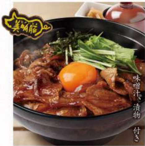
美明豚 豚井 甘辛ダレと豚の旨味が絶品! びみいんとん 海藻卵使用 味噌汁、漬物 付き 1,073円 (税込1,180円)