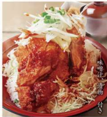
鬼辛 チキンカツ丼 サクサク!旨辛! 味噌汁、漬物 付き 900円 (税込990円)