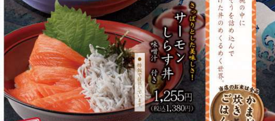
サーモン しらす丼 さっぱりとした美味しさ! 味噌汁 付き 1,255円 (税込1,380円)