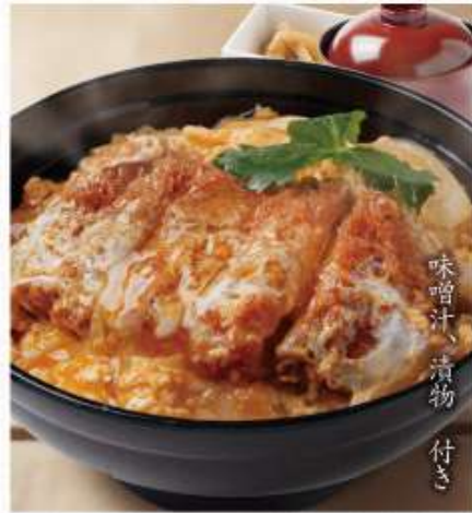
三元豚 かつ丼 旨味を玉子でとじました! 味噌汁、漬物 付き 982円 (税込1,080円)