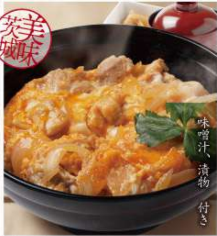
海藻卵の親子丼 一味達う至福の親子丼! つくば鶏と かいそうらん 味噌汁、漬物 付き 982円 (税込1,080円)