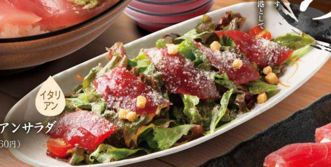
さっぱりとサラダで！ 三崎まぐろのイタリアンサラダ 873円(税込960円)