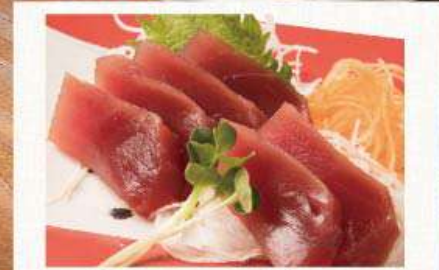
三崎まぐろのお造り 982円(税込1,080円)