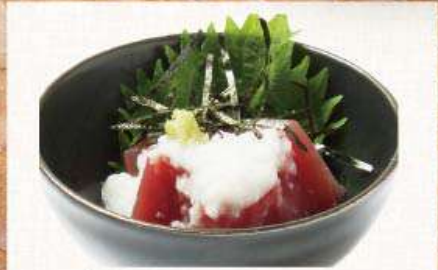
三崎まぐろの山かけ 537円(税込590円)