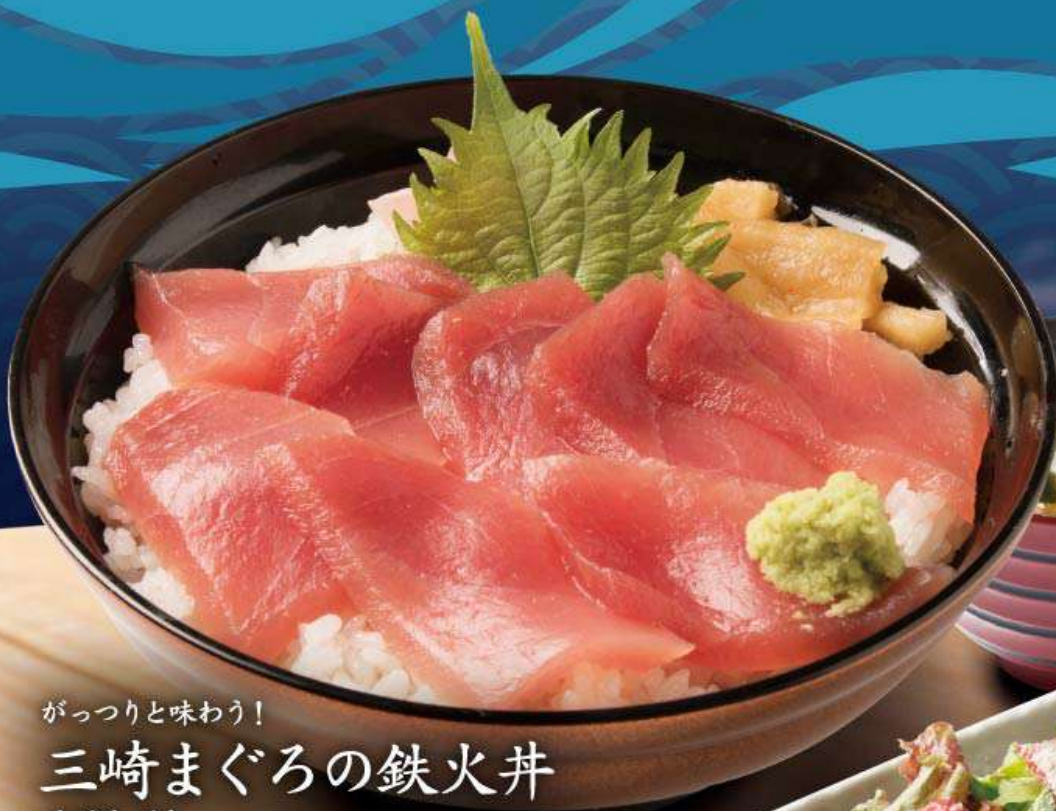
がっつりと味わう！ 三崎まぐろの鉄火丼 味噌汁付き 1,573円(税込1,730円)

三崎まぐろとは、神奈川県三浦半島にある 三崎漁港で水揚げされたまぐろのことをさします。 三崎漁港は全国有数のマグロの水揚量を誇る漁港として 知られ、新鮮なまぐろを常に味わえる漁港です。