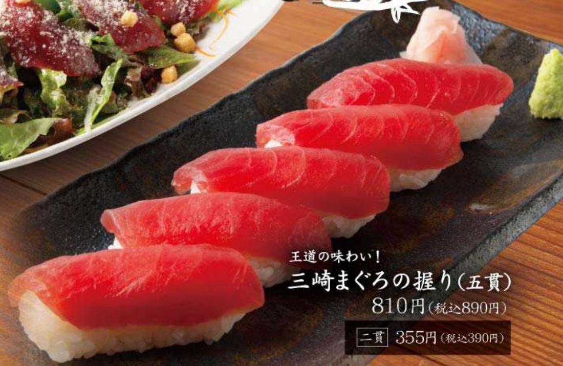
王道の味わい！ 三崎まぐろの握り(五貫) 810円(税込890円)