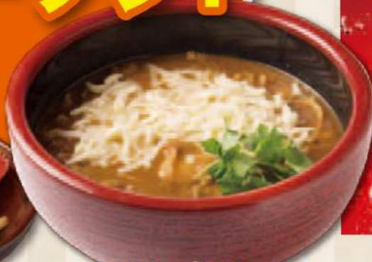
とろーりチーズのカレーうどん