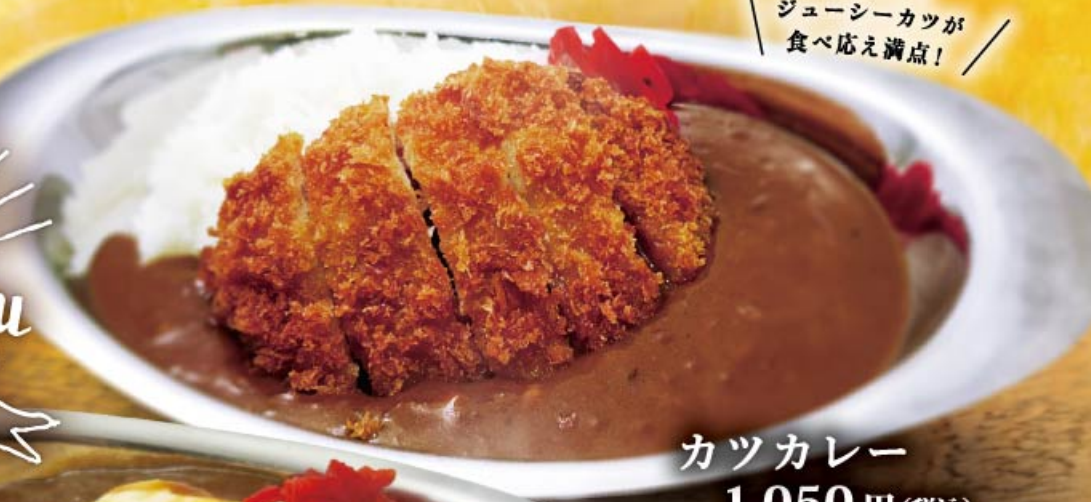
カツカレー 1,050円(税込)