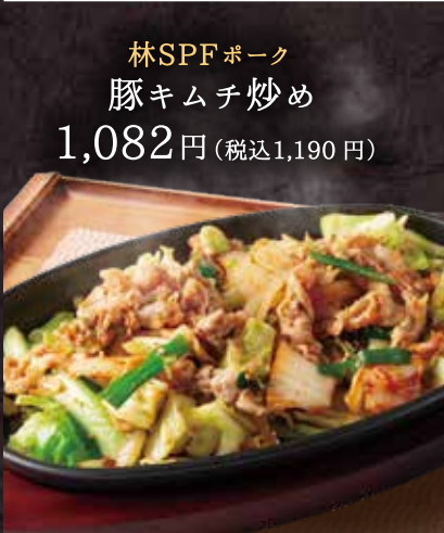
林SPFポーク 豚キムチ炒め 1,082円 (税込1,190円)