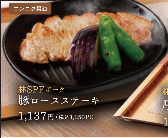
林SPFポーク 豚ロースステーキ 1,137円 (税込1,250円)