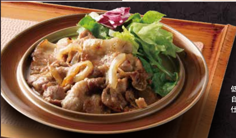
林SPFポーク 豚の生姜焼き 1,110円 (税込1,220円)

低カロリーで高タンパクな豚ロース肉！ 自家製生姜ダレで柔らかくジューシーに 仕上げました