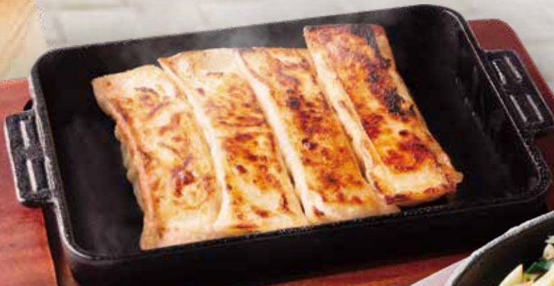
棒餃子 ぼうぎょうざ 546円 (税込600円)