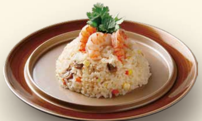
エビピラフ 755円 (税込830円)

王道のピラフにぶりぶりのエビをトッピング。 ちょうどいいサイズ感が嬉しいメニューです。