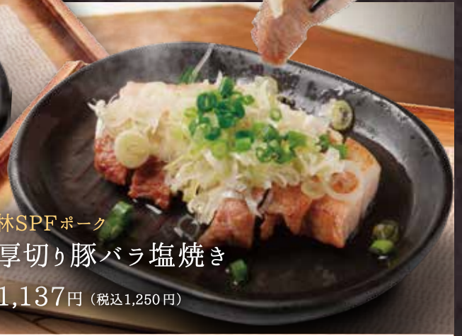
林SPFポーク 厚切り豚バラ塩焼き 1,137円 (税込1,250円)