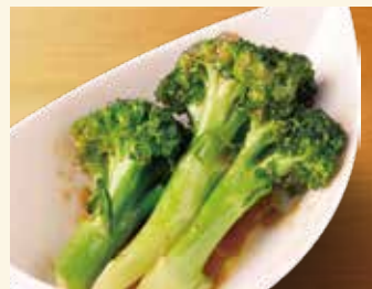
アンチョビブロッコリー 437円 (税込480円)