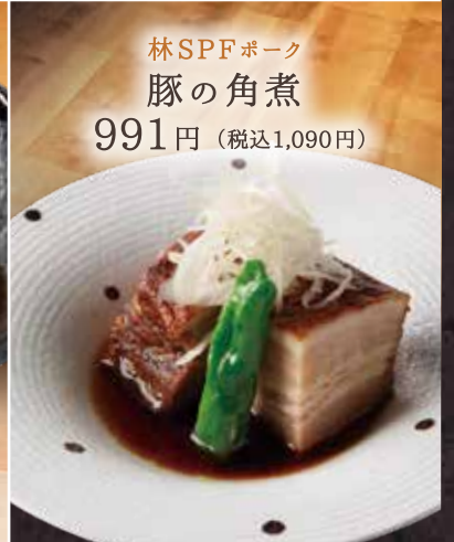
林SPFポーク 豚の角煮 991円 (税込1,090円)