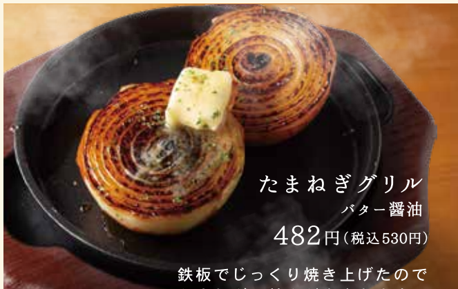
たまねぎグリル バター醤油 482円 (税込530円)