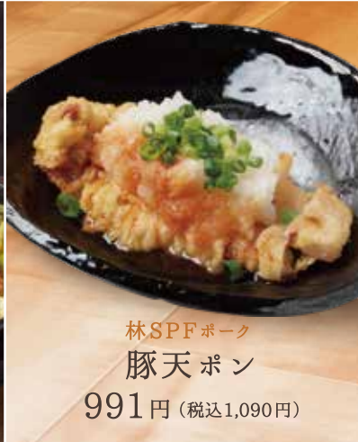
林SPFポーク 豚天ポン 991円 (税込1,090円)