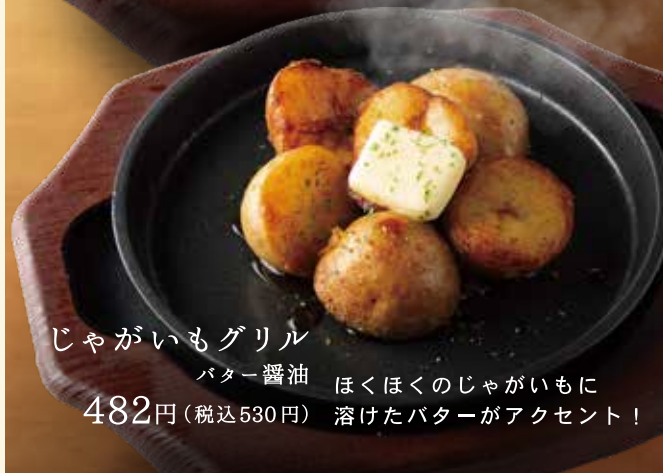
じゃがいもグリル バター醤油 482円 (税込530円)